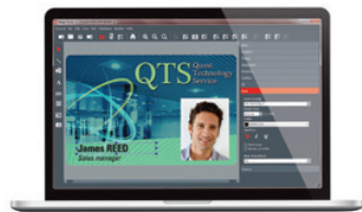
Personalisierungssoftware für Karten Evolis Badge Studio®+ (für den Import aus Datenbanken)